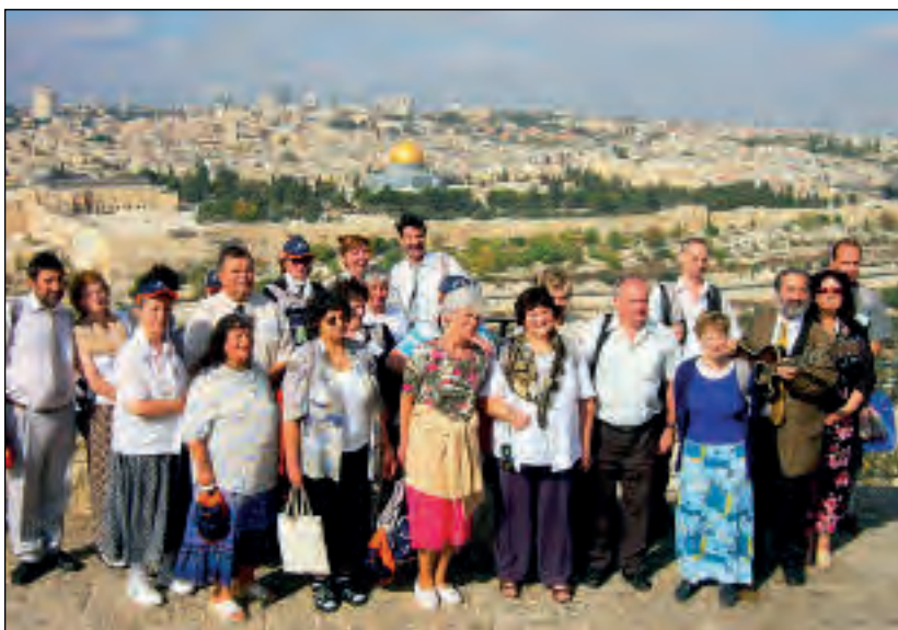
Un grupo de hermano húngaros del Beth-Shalom