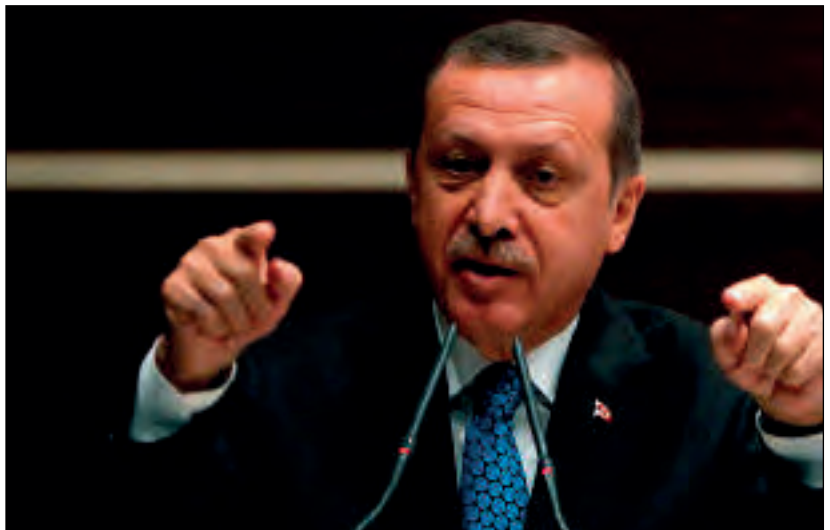
Foto: El primer ministro turco Erdogan provoca con extrañas teorías de conspiración.

“Todo el día mis enemigos me pisotean; porque muchos son los que pelean contra mí con soberbia.”