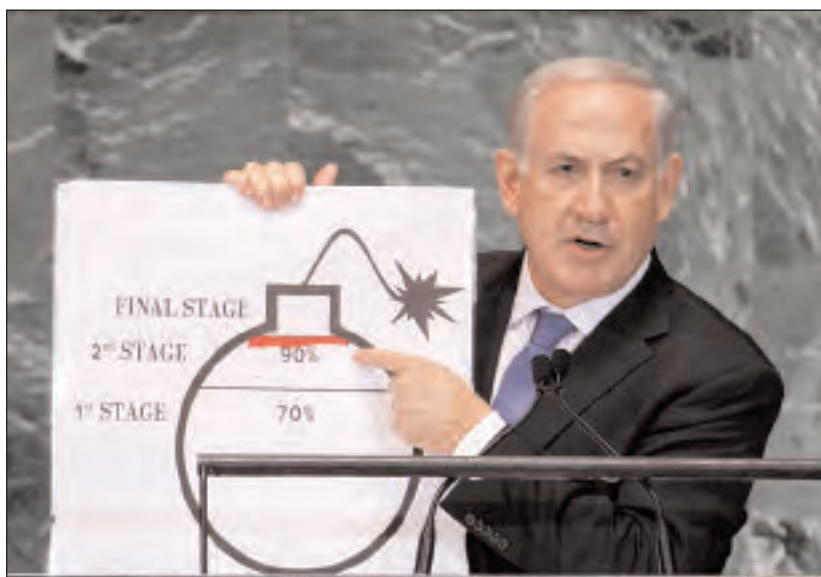
Primer Ministro Benjamín Netanyahu

Un tercer desafío es lograr una paz estable con los palestinos. Creo que el contexto para esa paz es el que he descrito en mi discurso en la Universidad de Bar Ilan: dos estados para dos pueblos; un estado palestino desmilitarizado que reconoce el estado judío.