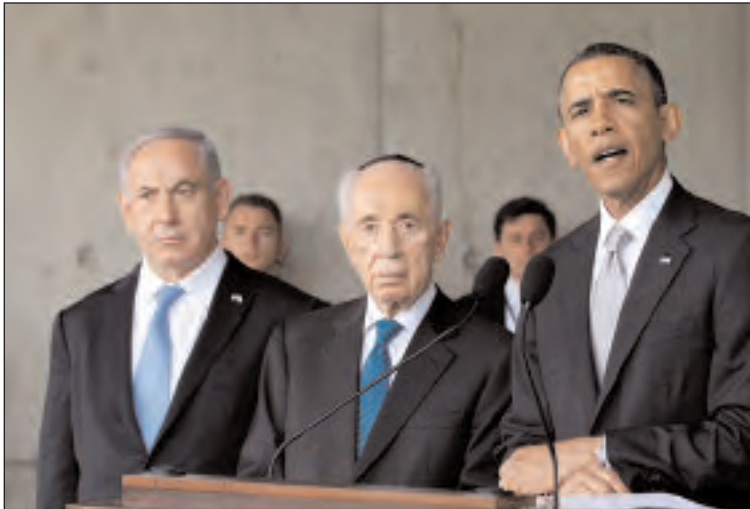
En su discurso de salutación, Obama dijo en hebreo: "Tow Lehiyot Shuw BaAretz."

Jerusalén. Veni, vidi, vici; vine, vi, vencí. Esta famosa frase es la que, sin duda, mejor resume la visita del presidente estadounidense a Israel. Durante su visita de 48 horas, que se extendió desde el miércoles al mediodía hasta el viernes antes del sabbat, logró cerrar un capítulo y abrir uno nuevo. Hemos dado cuenta una y otra vez sobre la antipatía personal entre Netanyahu y Obama, y también sobre los di-