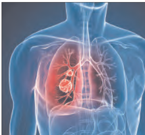
El dispositivo muestra ser revolucionario, especialmente en el diagnóstico precoz del cáncer de pulmón.

La Na-Nose ha madurado lo suficiente como para poder ser utilizada en laboratorios. Esto significa que ha madurado comercialmente, en otras palabras, que puede ser comercializada. Aun así, el prof. Haick tiene más proyectos. Aspira a que este dispositivo también esté disponible en los consultorios sencillos de los médicos. Con esto en mente, el renombrado cientí-