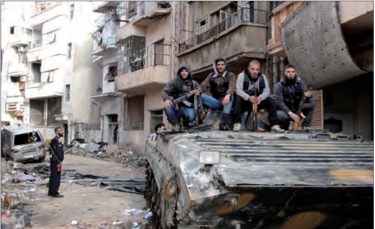
Existen informaciones acerca de los grupos de Yihad extremistas de los rebeldes que dan a entender que ya están considerando cómo poder utilizar los arsenales de armas de Assad en contra de Israel.

tarde o temprano llegará. La gran pregunta que surge es qué escenarios se desarrollarán antes de su caída y cuáles serán los poderes que se impondrán después de esta. Lo que es seguro es que después de dicha caída, el país se hundirá en un caos aún mayor al actual. Incluso si uno acepta la lucha de los rebeldes contra el régimen de Assad como una lucha legítima del pueblo sirio contra un dictador, ya no se puede negar que no es el pueblo sirio el que lucha. En las filas de los rebeldes se pueden encontrar seguidores de la organización terrorista internacional Al Qaeda. Recientemente se llegó a saber que estos se encuentran también en las inmediaciones de la frontera israelí.