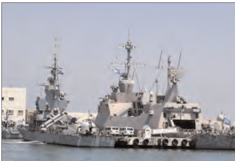
A causa de su ubicación, la protección de los yacimientos de gas corresponde en primer lugar a la marina israelí.

"Repentinamente, la región que tenemos que vigilar de aquí en más ha aumentado su ta-