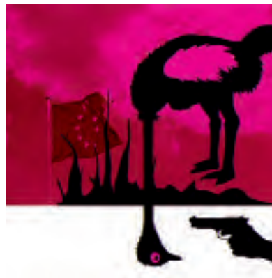
Los europeos debe finalmente despertar y dejar de usar la política de avestruz.

La razón para esta postura es sencilla: muchos estados europeos, sobre todo Francia, temen posibles consecuencias de una decisión de la UE en este asunto. No solo temen reacciones de Hezbolá en sus propios países, sino que también están preocupados por el bienestar de sus soldados que sirven en el contingente de los soldados de la ONU en Líbano.