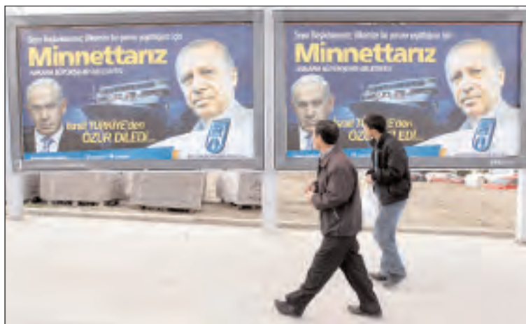
Netanyahu expresó frente a Erdogan que sentía "pena por errores que han llevado a ciudadanos turcos a perder la vida". En Turquía se pudieron observar estos carteles que hablan de la reconciliación turco-israelí.

Esta frase hacía referencia a los acontecimientos relacionados con la Flotilla de Gaza en general y en especial a los acontecimientos en el Mavi Marmara en mayo de 2010. El barco fue interceptado y abordado por soldados israelíes, acción durante la cual nueve turcos perdieron la vida. Finalmente, Netanyahu aceptó que el Estado de Israel pagaría una indemnización a las familias afectadas y que, mientras hubiera tranquilidad, no limitaría los movimientos de civiles turcos y de acciones comerciales turcas en la Franja de Gaza. En respuesta, el primer ministro turco se comprometió a suspender todos los intentos de emprender procesos jurídicos en contra de Israel. Ya había sucedido antes que Estados Unidos se encargara de que Erdogan se disculpara públicamente, particularmente por sus alegaciones ante el Gremio de la ONU en Viena. En esa oportunidad, se pidió que se retractara de hablar del sionismo como "un crimen contra la humanidad". Además, se dice que Erdogan le prometió al presidente norteamericano no utilizar tales comparaciones en el futuro.