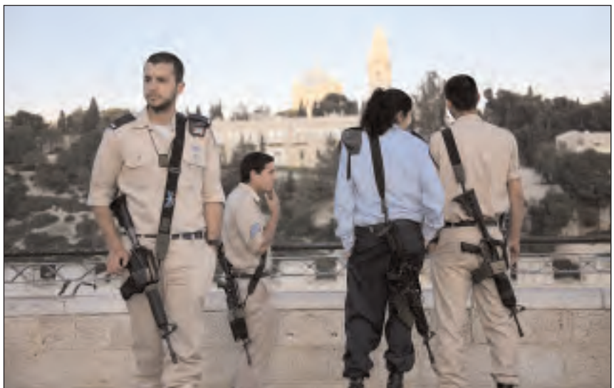
Jerusalén recién fue destruida unos 37 años después, a través de los romanos.