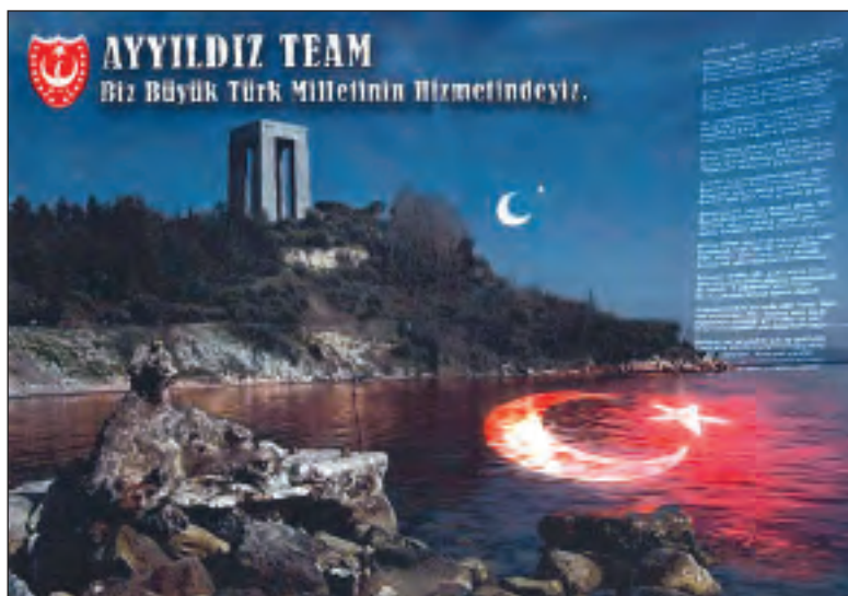
Nuestra página Web Hungará fue atacada por un hacker turco: La foto muestra un lugar de ejecución, mucha sangre y la media luna turca.

Como de costumbre, los colegas piratas informáticos israelíes no dejaron que eso siguiera así no más y se dispusieron al contra ataque, que fue muy bien planificado. Algunos, primeramente, pudieron paralizar por algunas horas el portal de la acción de colecta de donativos para la organización turca IHH, que organizó la Flotilla de Ga-