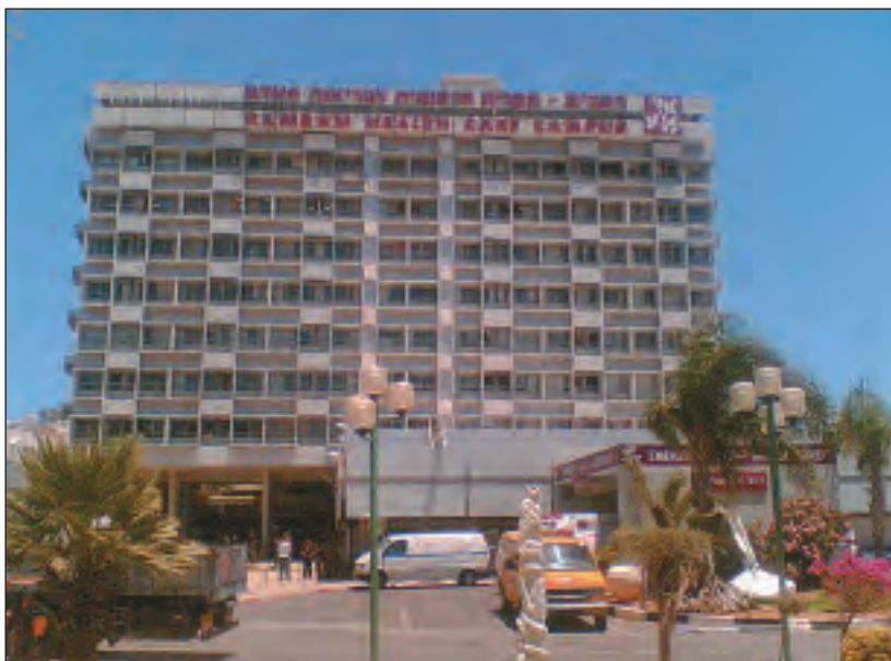
El Hospital Rambam en Haifa.

En el 90 por ciento de todos los judíos pudo demostrarse, en base a este estudio, que muestran marcadores genéticos que tienen su origen entre grupos de población del Levante (países del Mediterráneo al este de Italia, Red.). Los marcadores genéticos que indican una conexión con el judaísmo español o polaco, al contrario, son relativamente insignificantes. También las comunidades judías que ya hace cientos de años viven en Europa Central, por ejemplo, presentan marcadores genéticos que señalan un origen mediterráneo. Además, se pudo constatar que los marcadores genéticos que señalan una pro-