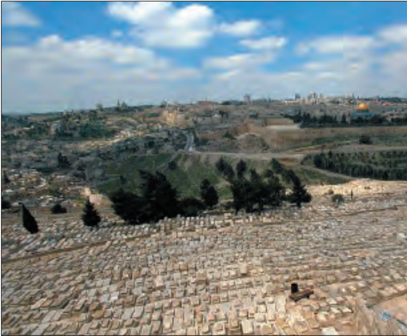
La legión árabe también profanó conscientemente las tumbas judías en el Monte de los Olivos.

provenían de Cam y no de Sem (Gn 10:6-21). Los árabes típicos, por el contrario, son una étnia semítica.