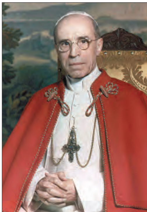
Papa Pío XII