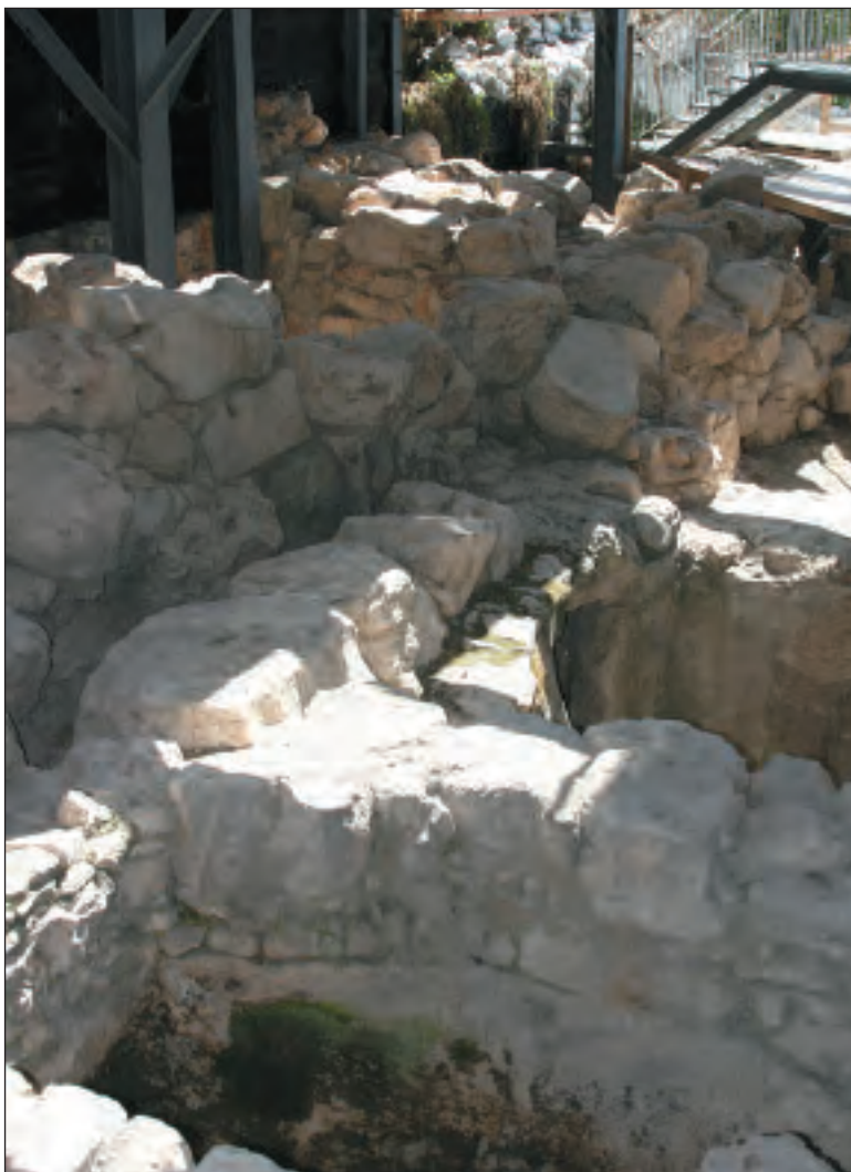
Este muro debe ser datado en el tiempo del dominio del Rey Salomón, constructor del primer templo e hijo del Rey David.