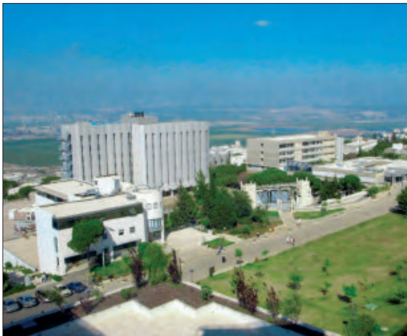
La nariz artificial desarrollada en el Tecni3n fue muy bien programada.

3xitos, publicando que la nariz artificial, bajo condiciones de laboratorio, pod3a diferenciar entre personas enfermas y sanas.