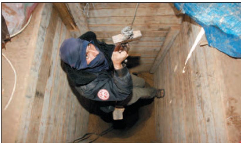
Se descubrió un túnel a una profundidad inesperada de 60 m debajo de la superficie.