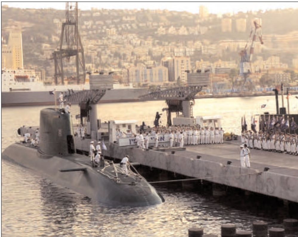
Israel hizo pasar uno de sus submarinos más combativos del Mar Mediterráneo, a través del Canal de Suez, al Mar Rojo.

esfuerzos hacia la detención del programa iraní de investigación nuclear continuaban concentrándose a nivel diplomático. Pero, solamente unos pocos días después, la Ministra del Exterior norteamericana Hillary Clinton dijo: "No vacilaremos en proteger y defender a nuestro país a través de nuestro ejército, que es el más fuerte del mundo." Casi al mismo tiempo, el almirante Michael G. Mullen, oficial de mayor rango de las fuerzas de combate norteamericanas, declaró: "Los esfuerzos diplomáticos deben