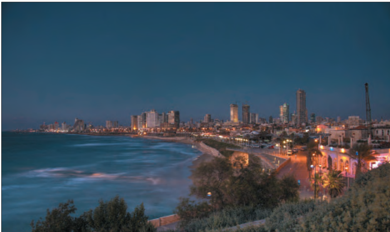
"Aún te edificaré, y serás edificada, oh virgen de Israel": La moderna ciudad de Tel Aviv

sa que: Él nuevamente está atrayendo a Su pueblo hacia Sí mismo, ya que el objetivo principal del regreso de Israel a su patria es que sea llevado al encuentro con el Mesías, cuando éste regrese (Jer. 31:2).