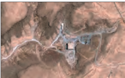
Hace menos de dos años atrás, aviones de combate israelíes bombardearon un centro de investigación nuclear en Dir A-Zur, Siria. Ahora, en ese lugar, nuevamente se pueden observar actividades que no son menos preocupantes.

Los mediadores norteamericanos que viajaron a Damasco para mejorar las relaciones, ya sabían, antes de su llegada, que los sirios mantenían una fábrica de sustancias bélicas, químicas y biológicas, en el lugar del reactor nuclear destruido. Ellos confrontaron a sus interlocutores sirios con eso. Los sirios ne-