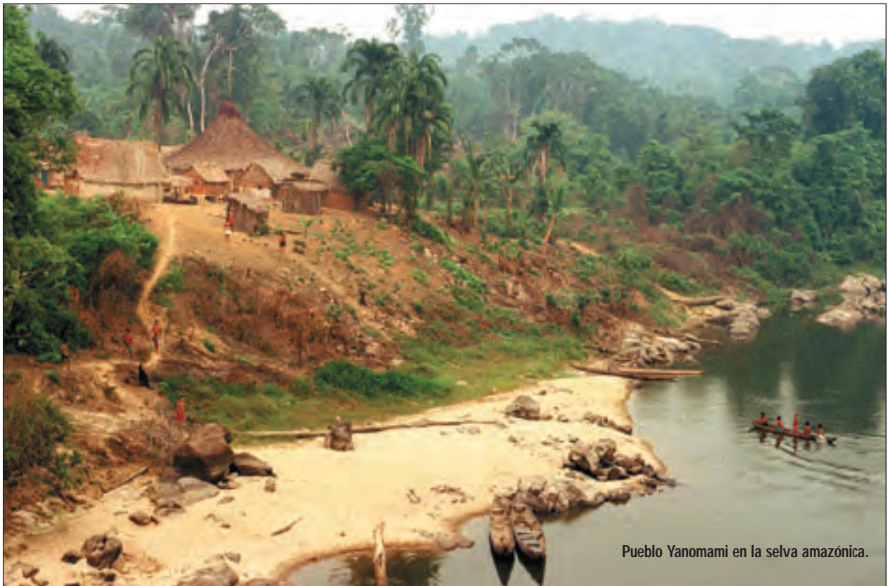
Pueblo Yanomami en la selva amazónica.

Según los “expertos”, lo mejor para los indígenas en la jungla sudamericana sería que fueran protegidos de todas las influencias “civilizadas” – sobre todo del evangelio. Pero, ¿será que los aborígenes de América del Sur realmente son tan inocentes? ¿De verdad viven tan pacíficamente, en total unidad con la naturaleza?