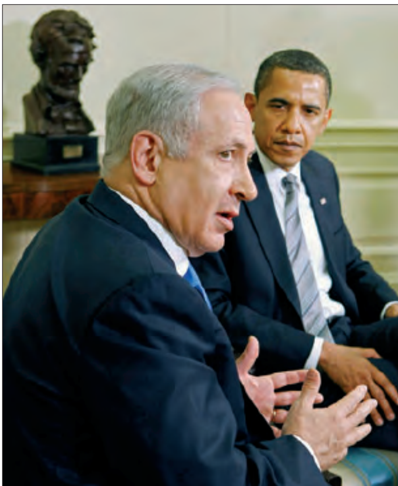
El Primer Ministro de Israel, Benjamín Netanyahu, visitando a Barak Obama.

Este cambio, sin lugar a dudas, se debe a la presión política que se le hizo sentir a Netanyahu en EE.UU. El jefe de estado mayor de Obama, Rahm Emanuel, quien a causa de su padre israelí