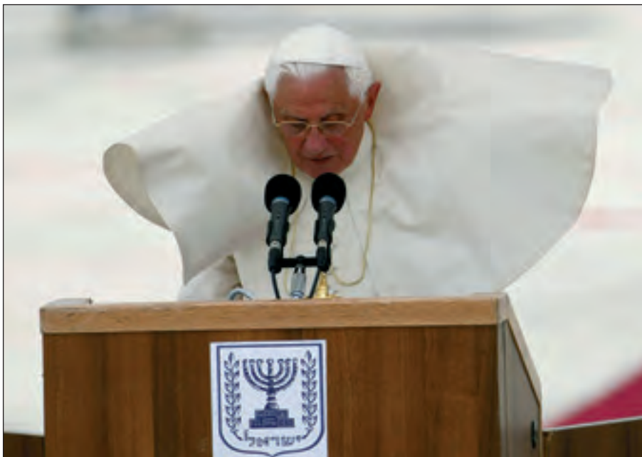
Durante la visita del Papa a Israel se produjo la profanación total de un cementerio en Cisjordania.

El porcentaje de cristianos entre los palestinos es evaluado mundialmente en alrededor de un diez por ciento. A causa de las represalias de la mayoría musulmana se puede observar, ya desde hace décadas, una emigración masiva de la Tierra Santa. Acerca de esto, recientemente se publicaron números con respecto a la parte oriental de Jerusalén, números que son sintomáticos de la totalidad del desarrollo de este acontecimiento. Solamente un dos por ciento de los habitantes de Jerusalén son cristianos, es decir, que